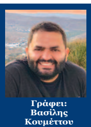
Γράφει: Βασίλης Κουμέττος