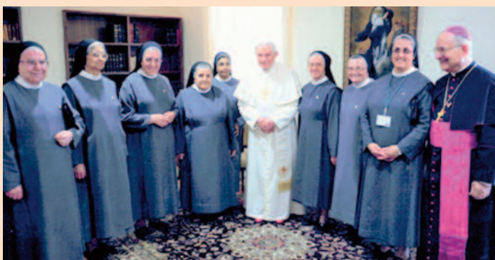
Από την επίσκεψη του Πάπα Βενέδικτου στην Κύπρο.