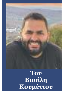
Του Βασίλη Κουμέττου

έπληξε μέλη της. Από την αρχή της πανδημίας τον περασμένο Μάρτιο είχαμε άπαντες αντιληφθεί την αναγκαιότητα να προστατεύσουμε τους εγκλωβισμένους μας από τον κορωνοϊό, τους ανθρώπους εκείνους που κράτησαν τα χωριά μας στη ζωή όλα αυτά τα χρόνια και που ανήκουν ως επί το πλείστον στις εύάλωτες ομάδες του πληθυσμού. Ευτυχώς, από το