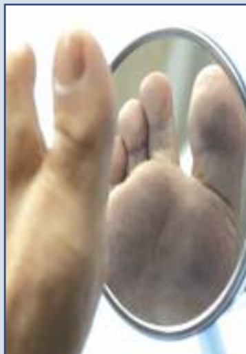
ελέγχετε συχνά τα πέλματά σας με κάποιον καθρέφτη. Στεγνώστε

τα πόδια καλά ιδιαίτερα μεταξύ των δακτύλων.