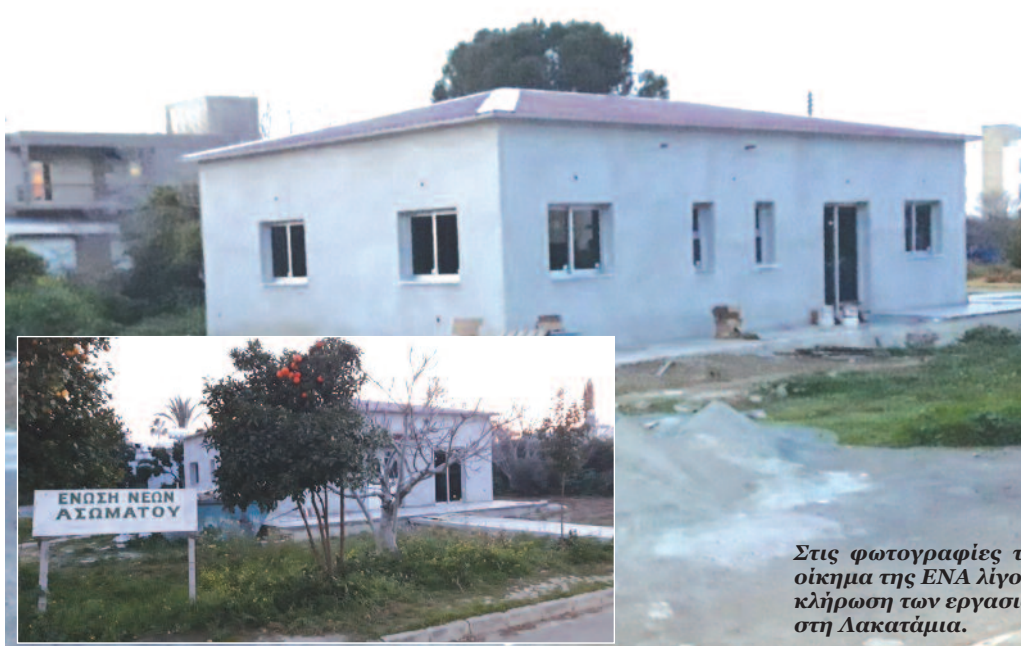
Στις φωτογραφίες το προσωρινό οικήμα της ΕΝΑ λίγο πριν την ολοκλήρωση των εργασιών ανέγερσης στη Λακατάμεια.