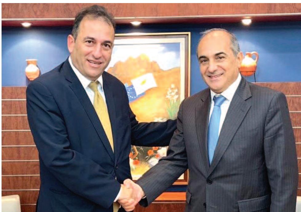
Με τον Πρόεδρο της Βουλής των Αντιπροσώπων Δημήτρη Συλλούρη.

Μετά και τη συνάντηση που είχε με τον Πρόεδρο της Βουλής Δημήτρη Συλλούρη στις 25 Νοεμβρίου 2019, συνάντηση κατά την οποία τον ενημέρωσε για την πρόθεση του αυτή, ο Γιαννάκης Μούσας προχώρησε σε σειρά επαφών με τις πλείστες πολιτικές δυνάμεις του