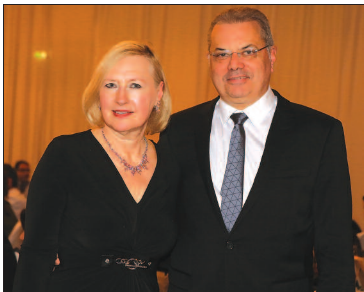
Ο Υπουργός Εσωτερικών Νίκος Νουρής μαζί με την Ειδική Αντιπρόσωπο των Ηνωμένων Εθνών Ελίζαμπεθ Σπέχαρ.