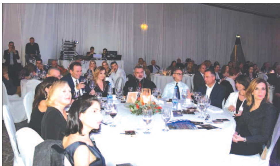
Στο τραπέζι των επίσημων ο Αρχιεπίσκοπος Μαρωνιτών, πολιτικοί αρχηγοί, υπουργοί, πρέσβεις και άλλοι επίσημοι.