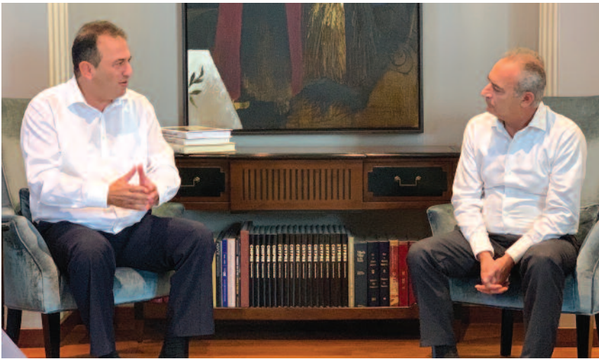
Με τον Πρόεδρο του ΔΗΣΥ Αβέρωφ Νεοφύτου.