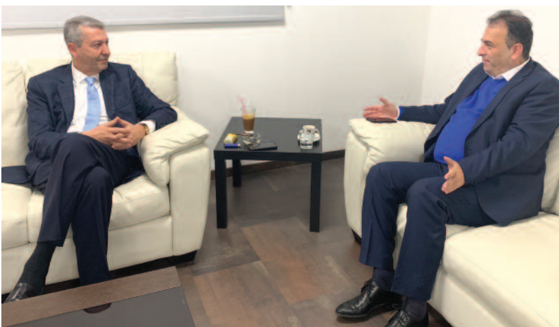
Με τον Πρόεδρο της Συμμαχίας Πολιτών Γιώργο Λιλλήκα.

Το εγχείρημα, όπως διαπιστώνει και ο ίδιος ο Γιαννάκης Μούσας, δεν είναι εύκολο, αφού ουδείς από τους προκατόχους του κατάφερε να επιτύχει κάτι, έχοντας το επιδιώξει, όπως αναφέρει, οι συνθήκες τώρα είναι πιο ώριμες από κάθε άλλη φορά και ομολογουμένως αυτό διαφάνηκε από τα αποτελέσματα των πρώτων επαφών που είχε με πολιτικούς αρχηγούς του τόπου. Όπως δήλωσε ο Εκπρόσωπος των Μαρωνιτών, ενίσχυση του θεσμού και του ρόλου του Αντιπροσώπου στη Βουλή σημαίνει ενδυνάμωση της Μαρωνιτικής Κοινότητας και ταυτόχρονα ενδυνάμωση της Κυπριακής Δημοκρατίας ως χώρας υπόδειγμα σε θέματα σεβασμού των Μειονοτήτων.