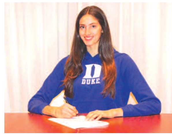
Νέο κεφάλαιο στην καριέρα της πετοσφαιρίστρας