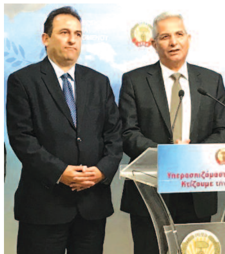
Με τον Γ.Γ. του ΑΚΕΛ Άντρο Κυπριανού.