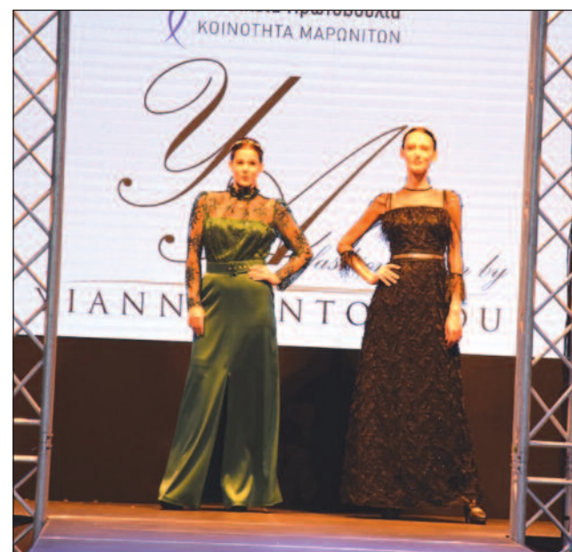
Στιγμιότυπα από την επίδειξη μόδας στην οποία συμμετείχαν μέλη της Μαρωνιτικής Κοινότητας με παρουσία στους τομείς της μόδας και του styling.