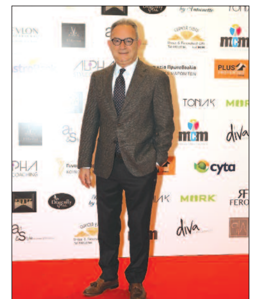
Ο Αβέρωφ Νεοφύτου.