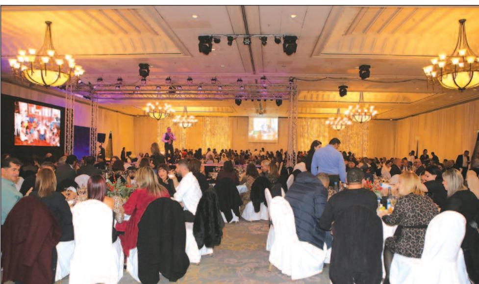
Γενική άποψη από την αίθουσα στο Hilton. Στην εκδήλωση παρενρέθησαν συνολικά τετρακόσια άτομα, ανάμεσα τους πολλοί επίσημοι.