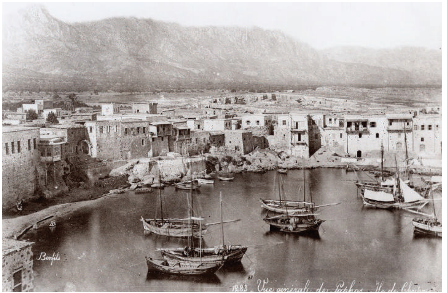
«Κερύνεια: στο βάθος αριστερά κάτω από τα βουνά βρισκόταν το τσιφλικι Φουντζί»

Το ζευγάρι απέκτησε δεκατέσσερα παιδιά, των