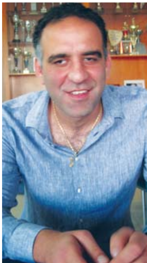
τα προβλήματα και επιθυμίες τους.

Όταν το νυν διοικητικό συμβούλιο ανέλαβε το σωματείο πριν ένα χρόνο είχε δεσμευτεί με ετήσιο πρόγραμμα δραστηριοτήτων το οποίο είχε δημοσιευτεί σε όλα τα ΜΜΕ της κοινότητας, και είχε ως στόχο μέσω των πολιτιστικών, ψυχαγωγικών, επιμορφωτικών και αθλητικών δραστηριοτήτων να φέρει τους Μαρωνίτες κοντά στην κοινότητα. Χωρίς δεύτερη σκέψη αυτή ήταν η μεγαλύτερη μας επιτυχία. Για να ολοκληρώσω την απάντηση στο ερώτημα σας, η επίτευξη του προαναφερόμενου στόχου έγινε μέσω της ολοκλήρωσης άλλων προτεραιοτήτων όπως εξυγίανση των οικονομικών, αναζήτηση νέων οικονομικών πόρων, συναντήσεις με διακεκριμένα άτομα της κοινότητας, συναντήσεις με τους δημάρχους Λακατάμιας και Έγκωμης, προσέγγιση των οικογενειών της ενορίας και πρώτιστα συζητήσεις με νέους για να αντιληφθούμε