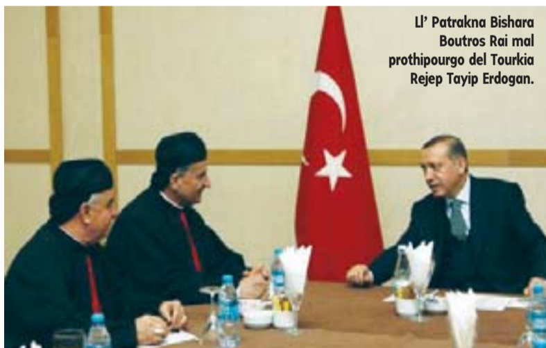
l' Patriarka Bishara Boutros Rai mal prothipourgo del Tourkia Rejep Tayip Erdogan.

Να φτύσω προς τα πάνω πέφτει στο κεφάλι μου, να φτύσω προς τα κάτω πέφτει στο γένη μου, καλύτερα να σιωπήσω.