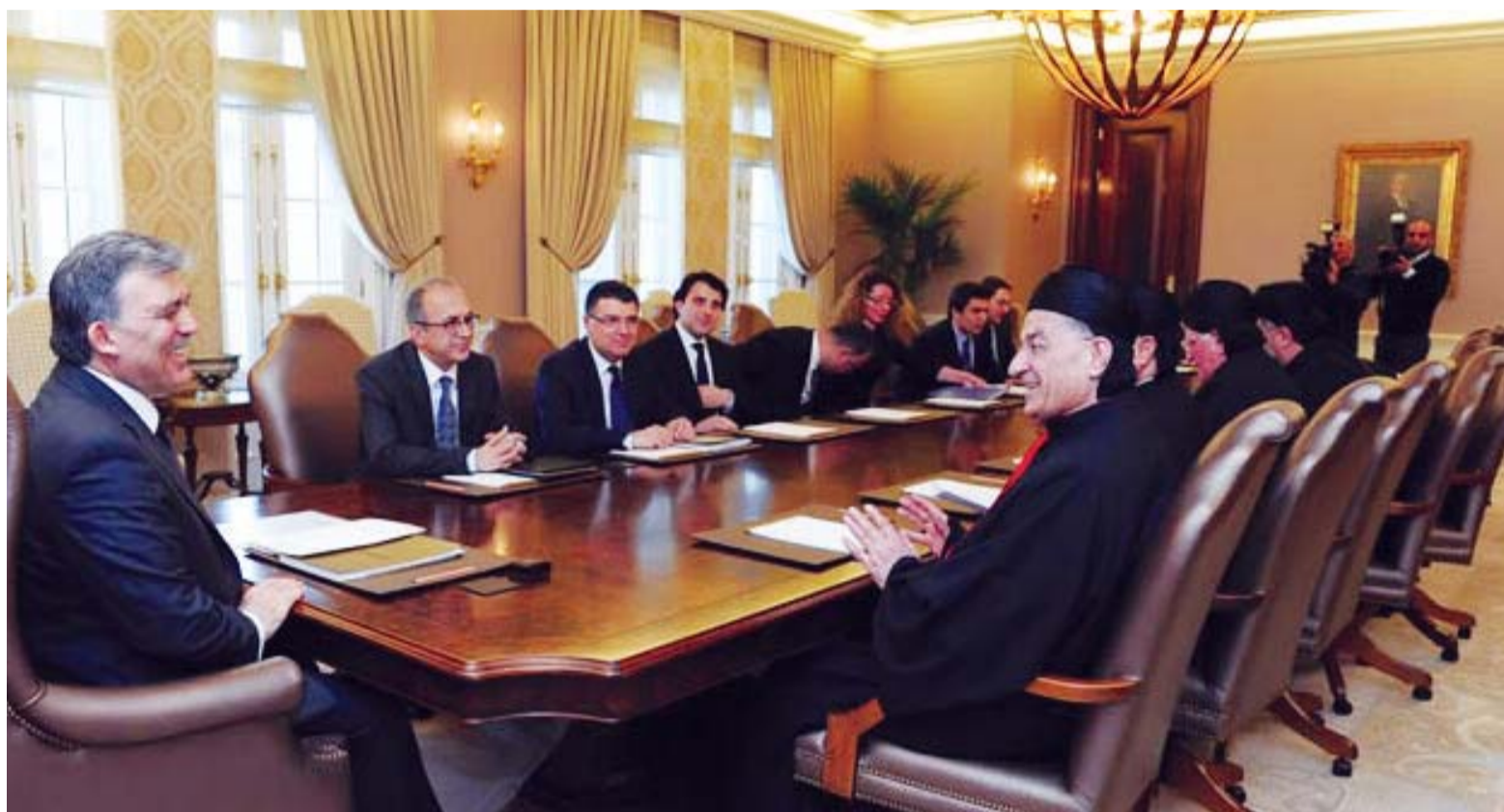
Από την συνάντηση του Πατριάρχη Μαρωνιτών Μπισάρα Ράι με τον Τούρκο Πρόεδρο Αμπντούλλάχ Γκιούλ στο λόφο του Τσάνκαγια στην Τουρκία.

Εδώ και αρκετό καιρό άρχισαν να κυκλοφορούν διάφορες πληροφορίες που έφεραν την Τουρκική πλευρά να προβαίνει σε κινήσεις καλής θέλησης προς τους Μαρωνίτες στην Κύπρο. Συγκεκριμένα αυτού του είδους οι πληροφορίες είδαν για πρώτη φορά το φως της δημοσιότητας την εποχή της επίσκεψης του Πάπα Βενεδικτού Ιβου στην Κύπρο πριν δηλαδή από δύο χρόνια. Η επίσκεψη του