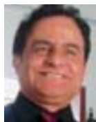
Του Σιάρπελ Τσουτσούκη

Ο ι συζητήσεις των τελευταίων χρόνων, σχετικά με το πολιτικό μέλλον των τριών μικρών κοινοτήτων της Κύπρου (Μαρωνιτών, Αρμενίων και Λατίνων), εξαντλούνται συνήθως στην ονοματολογία τους και τον αναχρονισμό του κυπριακού Συντάγματος. Οι σημερινές αντιλήψεις όντως ευνοούν χρήση διαφορετικής ορολογίας.