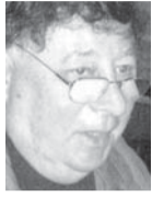
Του Αλεξάντερ Μποργκ

Τμήμα Εβραϊκής Γλώσσας Πανεπιστήμιο Ben Gurion- Negev