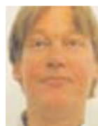
Του Arnold Elkaar

Ο Δρ Αρνολντ Εγκλααρ (1957) σπούδασε αρχαιολογία και αρχαία ελληνικά στο πανεπιστήμιο του Λεχδεν της Ολλανδίας. Υπόβαλε διδακτορική διατριβή στο πανεπιστήμιο του Άμστερνταμ το 1992 και δούλεψε σαν αρχαιολόγος στην Ελλάδα και στην Αίγυπτο (Αλεξάνδρεια). Σήμερα έχει ιδιωτικό γραφείο που συμβουλεύει το ολλανδικό κράτος για το θέμα αλλοδαπών εργαζόμενων. Από το 2005 έρχεται συχνά στον Κορμακίτη να περάσει τις διακοπές και μάζευε πολλά στοιχεία για την ιστορία των Μαρωνιτών και του Κορμακίτη.