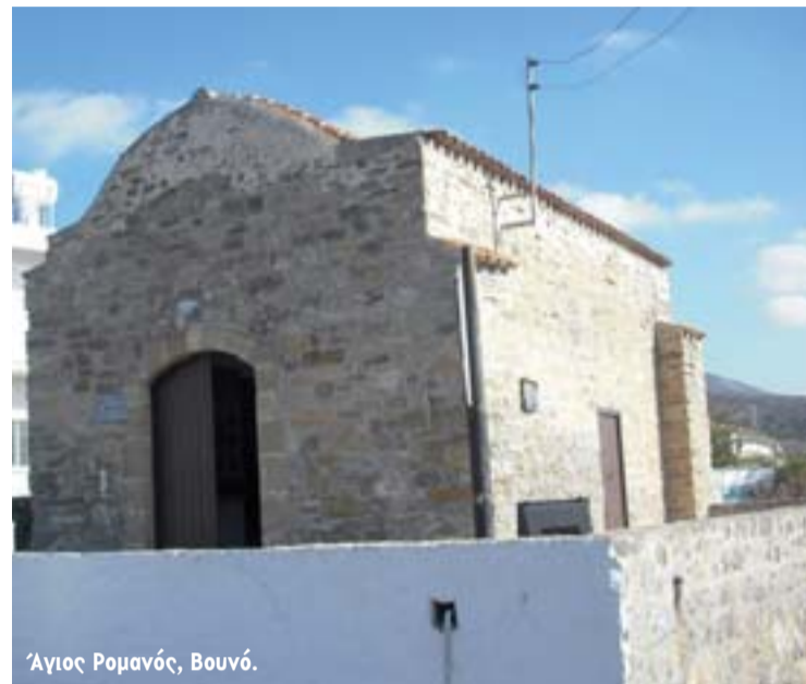
Άγιος Ρομανός, Βουνό.