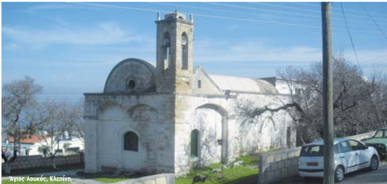
Άγιος Λουκάς, Κλεπίνη.