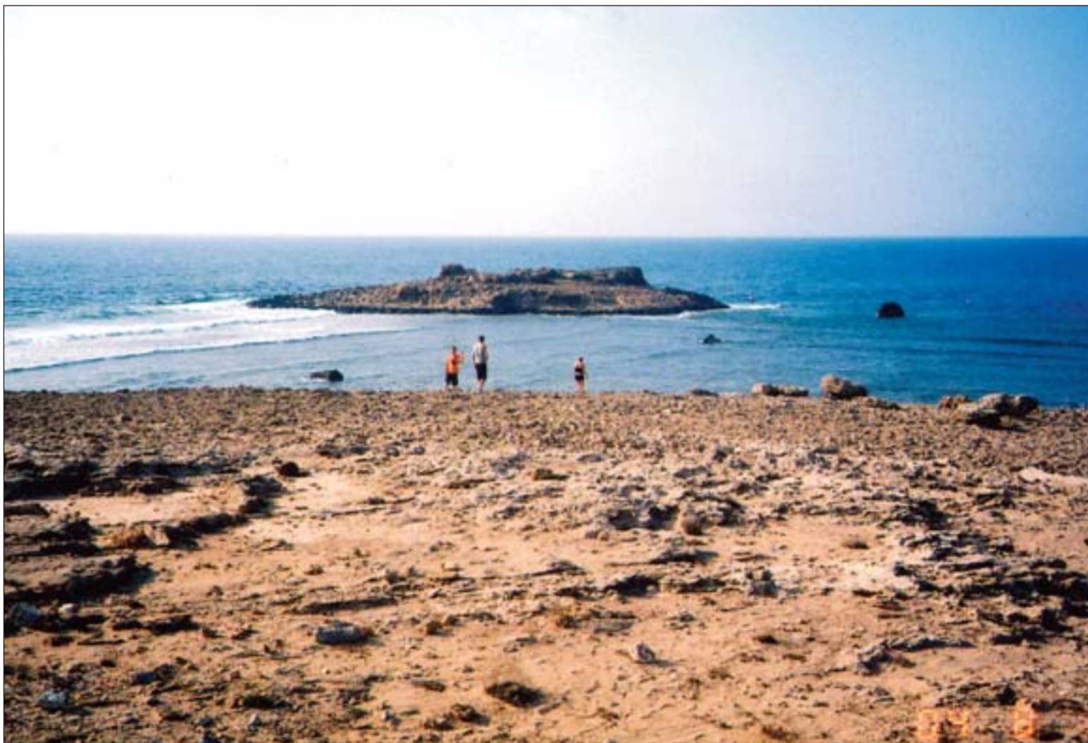
Η περιοχή Φάρος στο ακρωτήριο Κορμακίτη την οποία οι κάτοικοι του χωριού αποκαλούν Πουρζ, που στην αραβική σημαίνει Φάρος.

Στην γύρω περιοχή του Κορμακίτη έχω μαζέψει