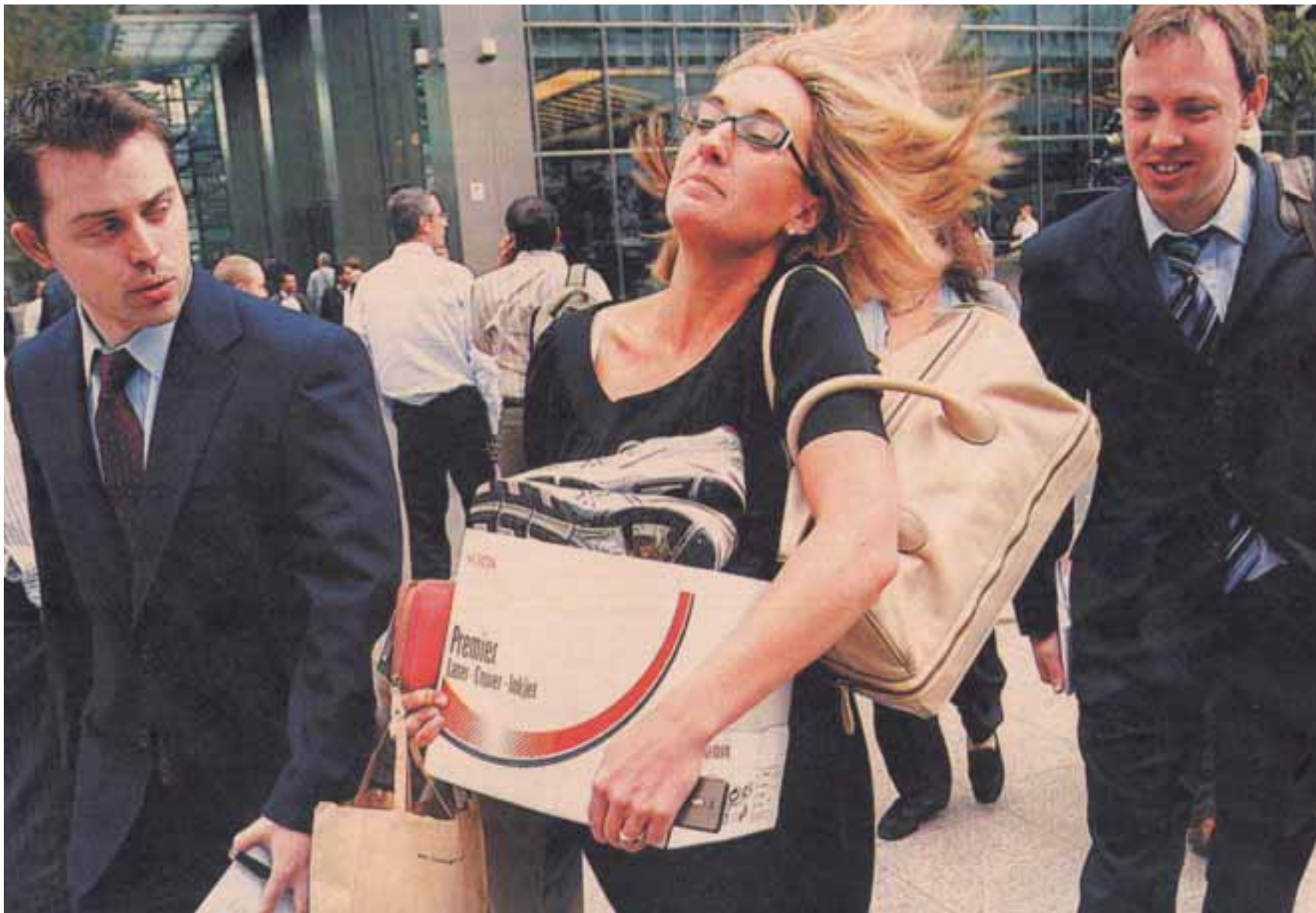
Υπάλληλοι της Lehman Brothers αποχωρούν από τα γραφεία τους μετά την πτώχευση της εταιρείας που αποτέλεσε την απαρχή του παγκόσμιου οικονομικού κρίσης.