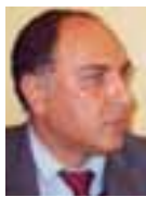
Του Αντώνη Π. Σκούλλου*

Α ναμφίβολα, το μεγαλύτερο πρόβλημα που απασχολεί την Μαρωνική Κοινότητα τα τελευταία 35 χρόνια, ένεκα της Τουρκικής εισβολής και κατοχής, παραμένει να είναι η προσπάθεια για επιβίωση. Οι πρόσφατες όμως συνθήκες που δημιουργήθηκαν για τους Μαρωνίτες της Κύπρου, σαν αποτέλεσμα του ανοίγματος των οδοφραγμάτων και η σχετική ελεύθερη διακίνηση με κάποια από τα χωριά μας, προκάλεσε τον έντονο προβληματισμό που άπτεται απόλυτα με την προσπάθεια για επιβίωση. Αυτών της επιστροφής. Μια έννοια και ένα σύνθημα, που πολλάκις θα το ακούσουμε να αναφέρεται ανά-