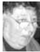
Του Αλεξάντερ Μποργκ

Τμήμα Εβραϊκής Γλώσσας Πανεπιστήμιο Ben Gurion- Negev