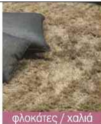
φλοκάτες / χαλιά