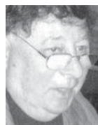
Του Αλεξάντερ Μποργκ

Τμήμα Εβραϊκής Γλώσσας Πανεπιστήμιο Ben Gurion- Negev