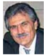
Του Ανδρέα Φραντζιά

Έχουν χρέος ιερό οι νεότεροι, να διατηρήσουν αλώβητη και ζωντανή τη μνήμη τους, για να μπορούν να ελπίζουν!