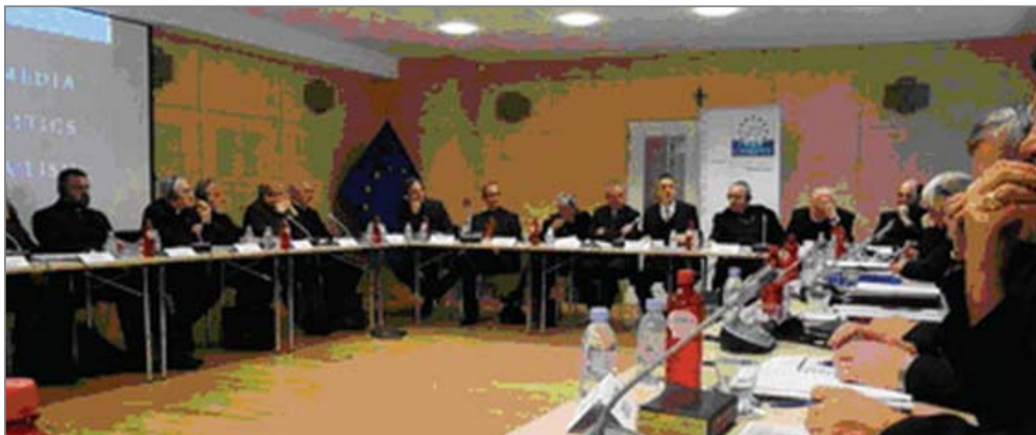
COMECE is one of many other ecclesiastical spaces where not only the Maronite Archeparchy has its contribution, but Cyprus as a country is also present in this context of reflection and dialogue based on the human and religious values of the European Union.

"We realise the uncertainty and insecurity of the present time. Yet we call upon Christians to resist the pull of populism and to swim against the tide: the Gospel calls us to do this today as it did former generations. Not in order to engage in a battle of cultures or ideologies, but rather to lay down the principles that are at the root of everything: the steadfast dignity of every human person - as so loved and wished for by God - and the common good, which reminds us time and again to show solidarity and to love our neighbour."