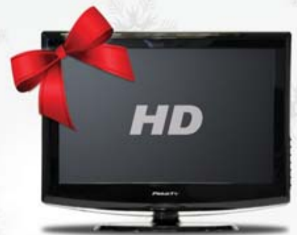
LCD TV 22"