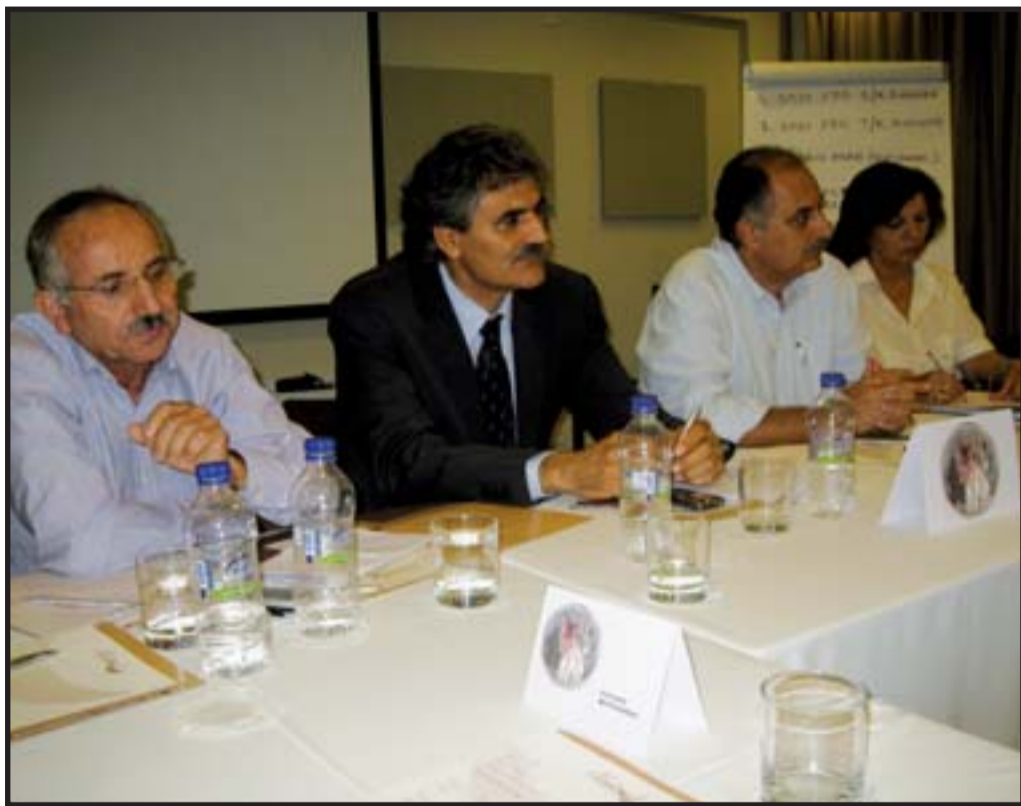
Ο Ασώματος, κατά τον κ. Φραντζιά, πρέπει να βρίσκεται στην πρώτη γραμμή, και αυτό τον στόχο εξυπηρετούν οι εκδηλώσεις του Ομίλου, όπως το πρόσφατο Συνέδριο.

Ας ξεφύγουμε από την εσωστρέφεια που τόσα χρόνια μας ταλαιπωρούσε. Βρισκόμαστε σε μια ανοικτή κοινωνία, με άμεσο τον κίνδυνο της αφομοίωσης. Οι προσπάθειες όλες να κινούνται στο πλαι-