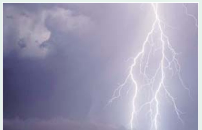
Οι κυνηγοί δεν πρέπει να ξεχνούν ότι τα μεταλλικά αντικείμενα που μεταφέρουν μαζί τους ίσως να ελκίσουν κάποιον κεραυνό. Γι' αυτό πρέπει να τα ξεφορτωθούν το συντομότερο.

● Να σημειωθεί τέλος, ότι, στην περίπτωση που επίκειται χτύπημα από κεραυνό, το ανθρώπινο σώμα "προειδοποιεί", μερικά χιλιοστά του δευτερολέπτου πριν, ότι έχει γίνει στόχος. Το δέρμα μυρμηγκιάζει, ενώ λόγω του στατικού ηλεκτρισμού ανορθώνονται προς τα πάνω οι τρίχες των μαλλιών του κεφαλιού. Το μόνο που έχετε να κάνετε, τότε, είναι να πέσετε μπρούμυτα στο έδαφος.