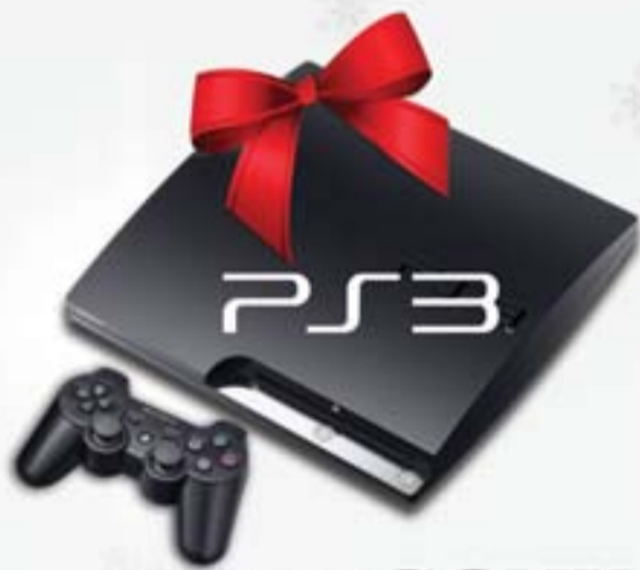
NEO SONY. Playstation®3 Slim

Αγαπητέ Άγιο Βασίλη, Φέτος τα Δώρα θα τα πάρουμε από την PrimeTel Με αγάπη, Έρσηνα