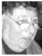
Του Αλεξάντερ Μποργκ

Τμήμα Εβραϊκής Γλώσσας Πανεπιστήμιο Ben Gurion- Negev