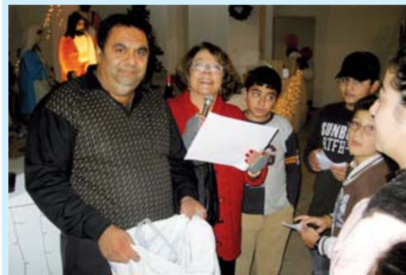
Saru sine xtir kaes bazar ta pisaou l' Maronites tel Lemeso. Antaxt rax ou l' Iskof ou tsharra maxon.

Rakkipra, ma pittaxter baxta = Βοήθα την να καβαλλικέψει, δεν μπορεί μόνη της.