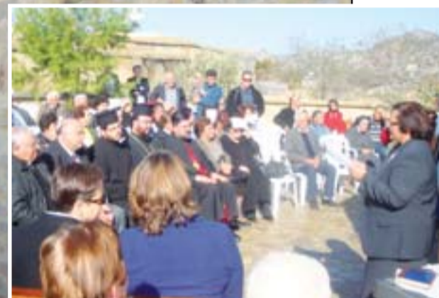
Ll' Iskof ma koullon lli ksous katsou l' catra tel Kampili.