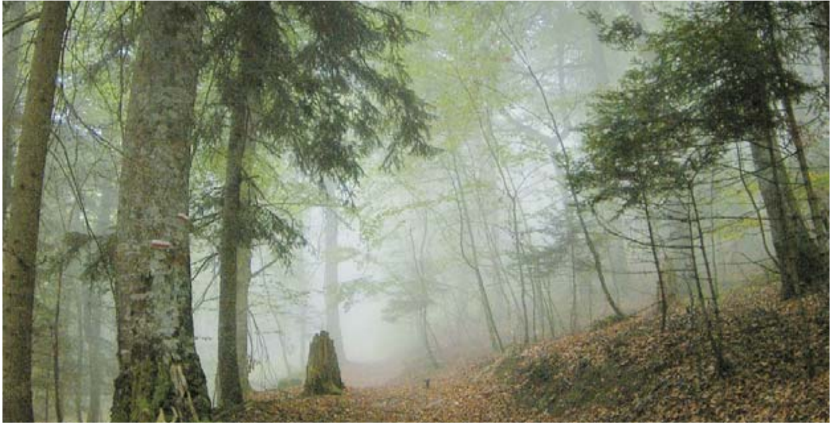
Εάν ο κυνηγός βρεθεί αντιμέτωπος με ακραία καιρικά φαινόμενα, πρώτιστο μέλημά του πρέπει να είναι η διατήρηση της ψυχραιμίας του, γιατί, τα βρεγμένα ρούχα επαυξάνουν τον εκνευρισμό και τον πανικό.

Εάν τύχει να βρεθούμε στη μέση του πουθενά, αντιμέτωποι με ακραία καιρικά φαινόμενα, πρώτιστο μέλημά μας είναι να παραμείνουμε ψύχραιμοι και να προσπαθήσουμε να προστατευθούμε, γιατί, τα βρεγμένα ρούχα, πέραν από το "πάγωμα" και τη δυσκολία στην κίνηση, αυξάνουν τον εκνευρισμό και τον πανικό. Καλύτερη επιλογή το αδιάβροχο, εάν φυσικά υπάρχει διαθέσιμο. Θα πρέπει να τονίσουμε πως στο κυνήγι σε δασώδεις περιοχές, τους χειμωνιάτικους μήνες, είναι πιο βολικό να χρησιμοποιούμε αδιάβροχο που αποτελείται από σακάκι και παντελόνι. Κι αυτό γιατί, δεν θα μπλέκεται στα βράχια, τα κλαδιά και